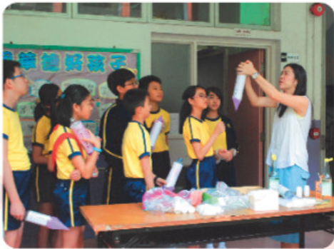
專心聆聽老師講解