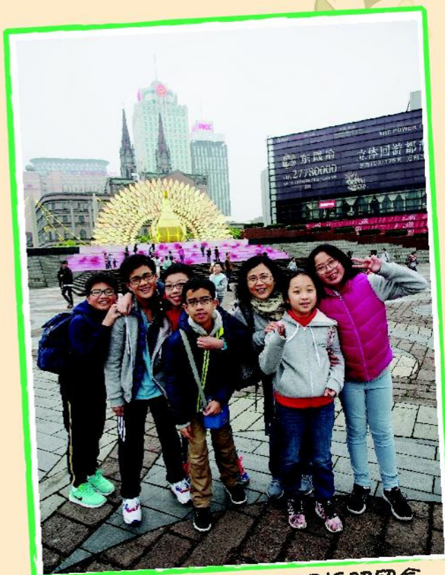
同學們與校長在天一廣場拍照留念

五天的旅程隨着飛機緩緩降落而進入尾聲，學生們突然唱起表演歌：「香港 我心中的故鄉 這裡讓我生長……香港 香港 載有我童年夢想……」老師教過的，他們都沒有忘記，相信他們不會輕易忘記在旅程中的所見所聞。原來，同學們的弟妹早已在入境關外排列整齊，同學們看見父母立刻上前互相擁抱，場面溫馨感動。