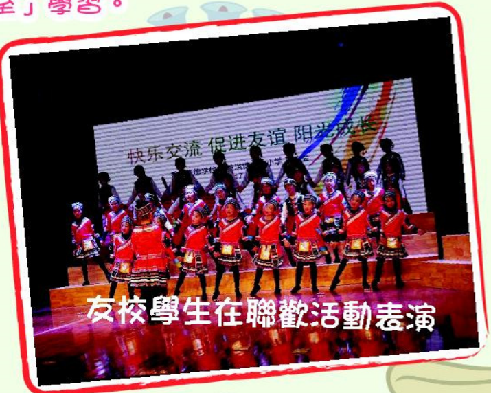
友校學生在聯歡活動表演

為了讓學生對學習蘇軾的詩文及杭州的特色有初步的了解，學校在出發前舉辦研習班。學生亦積極練習唱歌、跳舞，為在寧波洪塘中心學校的表演作好準備。同學們對是次交流活動十分期待。