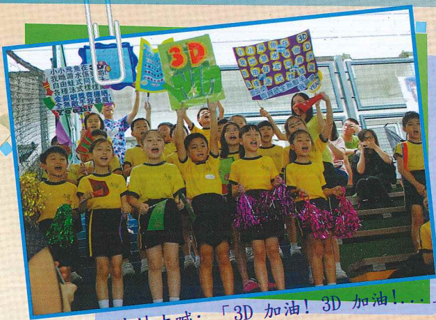
啦啦隊努力地大喊：「3D 加油！3D 加油！」