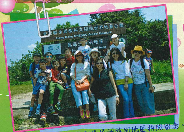
老師和同學們，一起在馬屎洲特別地區拍照留念。