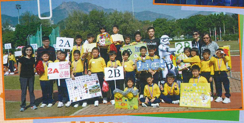
天氣真好，我們一起來個大合照！