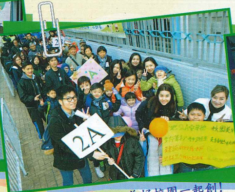
華德，華德是我家，美好校園一起創！