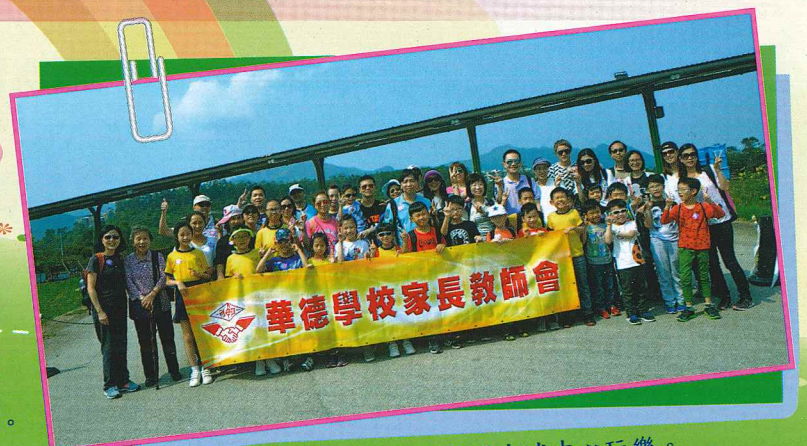
午飯後，我們到大埔船灣高爾夫球中心玩樂。