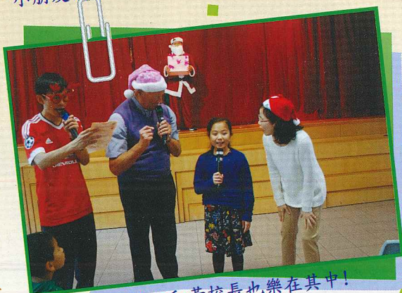
龔神父和黃校長也樂在其中!