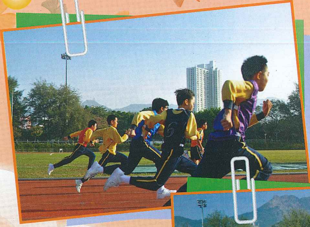
奔跑吧，我們的健兒們！