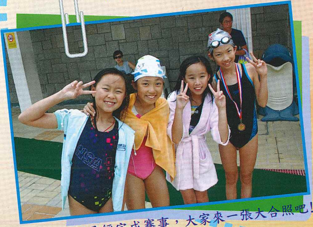
哈哈！我們已經完成賽事，大家來一張大合照吧！