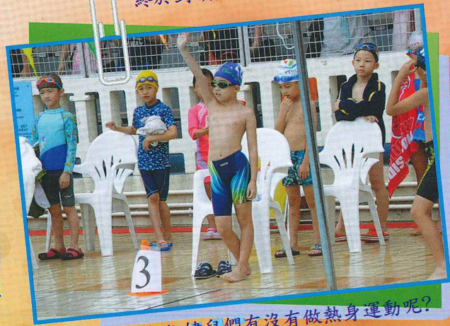
比賽前，各位健兒們有沒有做熱身運動呢？