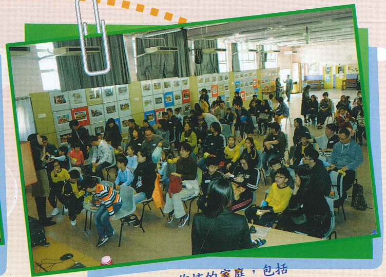
參與互動式親子工作坊的家庭，包括華德學校及九龍塘天主教華德學校。