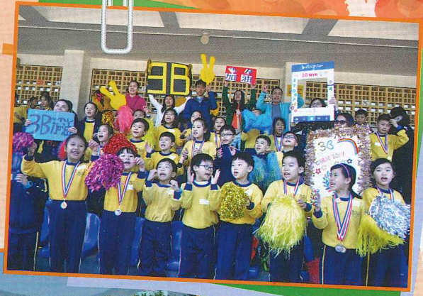
華德健兒無得頂，個個都係精英！