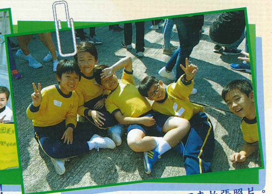
其實我們一點也不累，只是坐下來拍張照片。