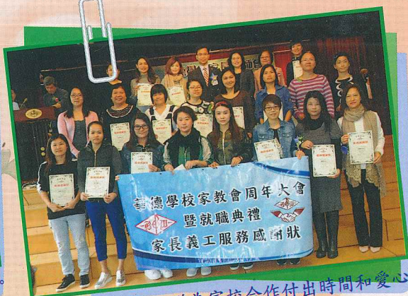
衷心感謝家長義工隊為家校合作付出時間和愛心!