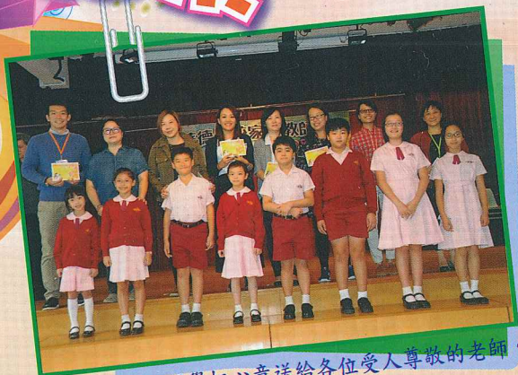
敬師環節中，同學把心意送給各位受人尊敬的老師。