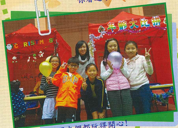
小朋友們都玩得開心!