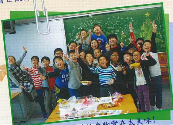
Yeah! 大家準備的食物實在太美味!