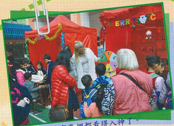
你看連家長們都看得入神了。