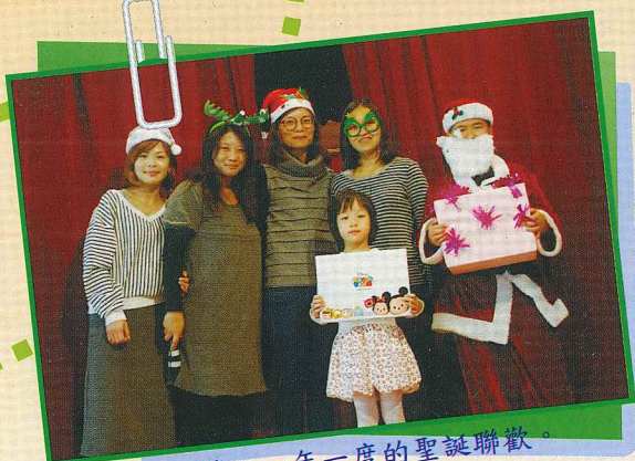
普世歡騰，一年一度的聖誕聯歡。