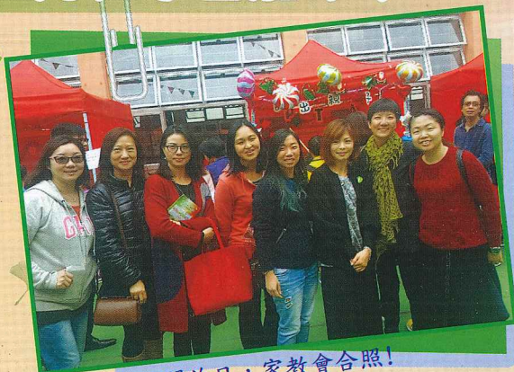
開放日，家教會合照!