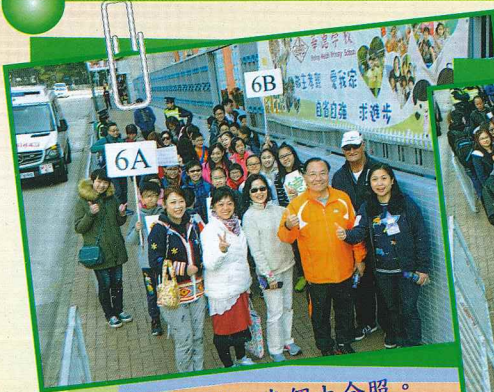
出發前，笑一笑，來個大合照。