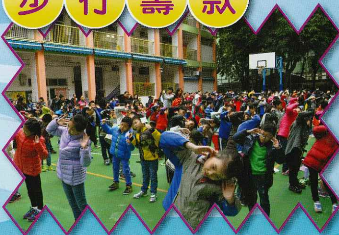
步行籌款前, 先來個熱身!