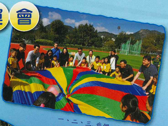
一、二、三, 我們一起向上拋!