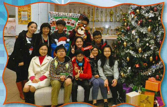
華德舊生也回來趁熱鬧，與校長及老師們拍照留念。