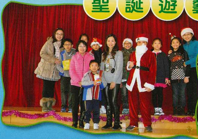
讓我們跟聖誕老人來個大合照！