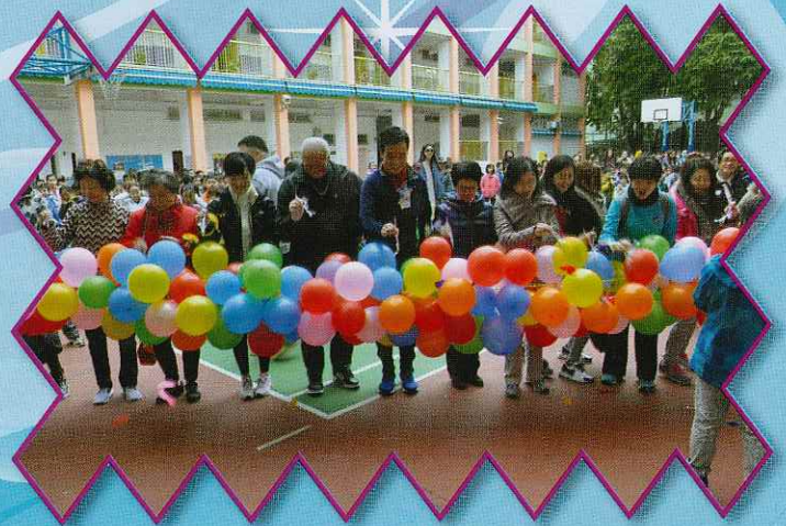
步行籌款正式開始!