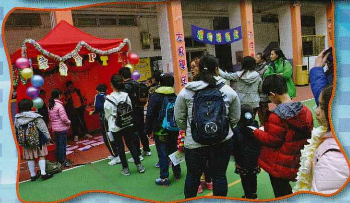
大家快來排隊，PTA的攤位遊戲開始了！