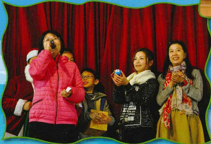
又是抽獎的環節，你估我有沒有機會中大獎！