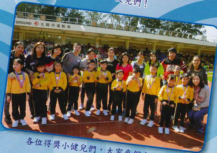
各位得獎小健兒們, 大家來個大合照!