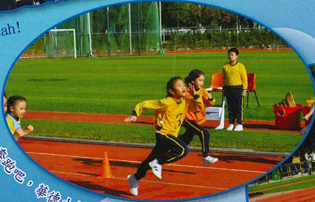
奔跑吧, 華德小健兒們!