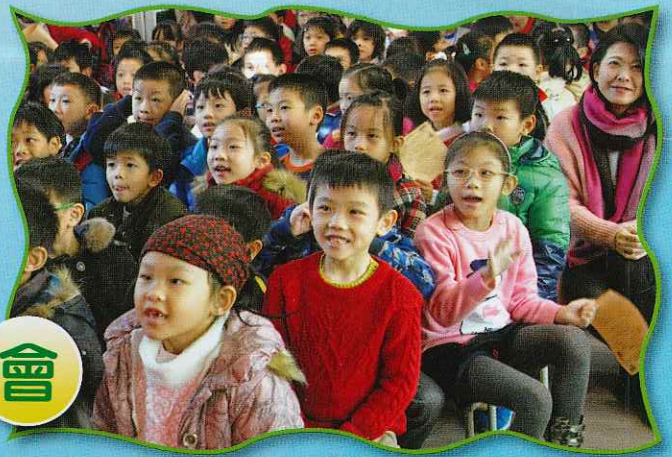
表演很精彩呀，大家都看得很入神！