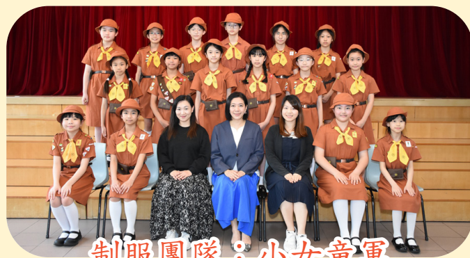
制服團隊：小女童軍