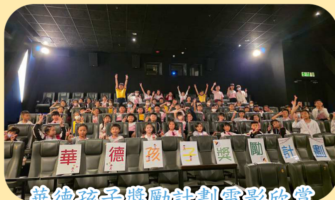
華德孩子獎勵計劃電影欣賞