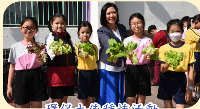
環保大使種植活動