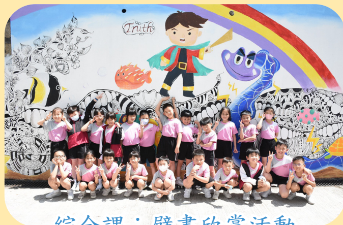
綜合課：壁畫欣賞活動