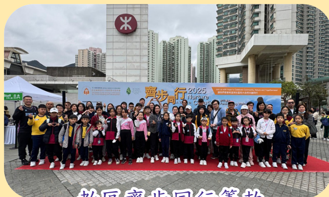
教區齊步同行籌款