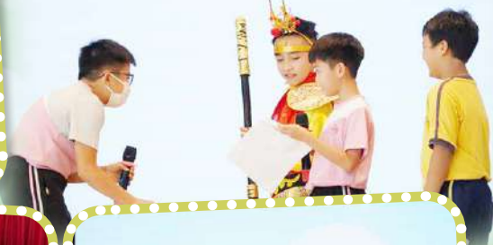
西遊記：難辨真假美猴王